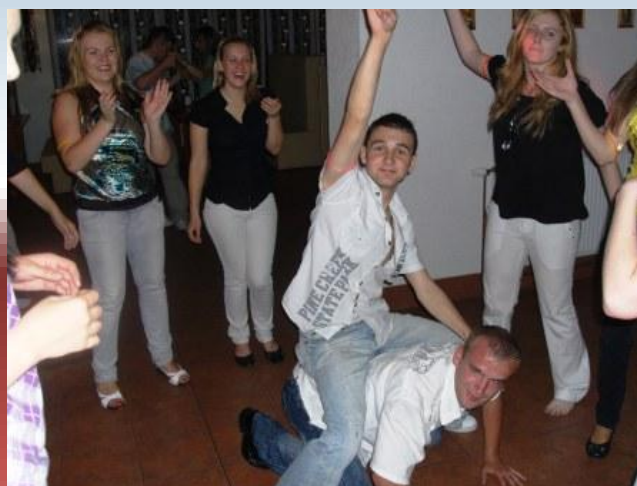
Kto tu je šéf... Kto tu jest szefem?