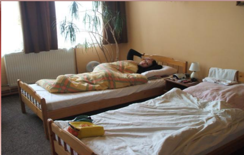
Trošku únavy pred záverom Trochę zmęczenia przed zakończeniem