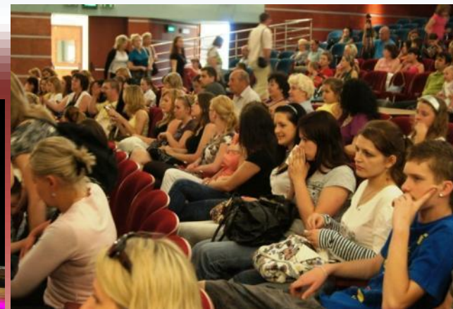
Pozorní poslucháči Uważni słuchacze