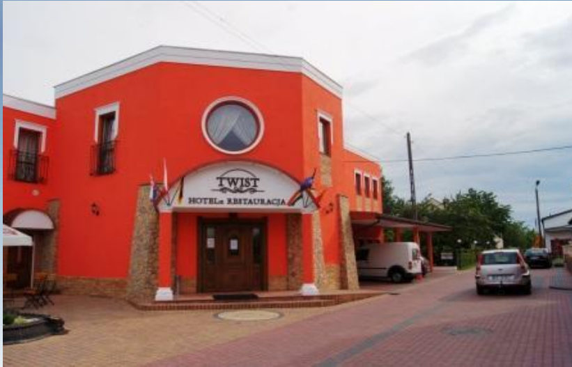
Posledné pohľady na naše ubytovanie Ostatnie spojrzenie na miejsce naszego pobytu