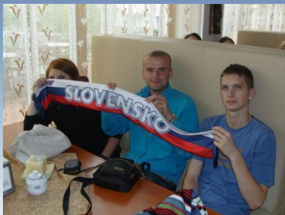
Prežívame futbalové okamihy Przeżywamy futbolowe emocje