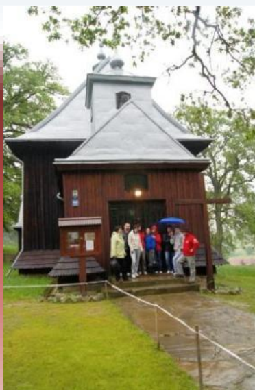
Návšteva historického kostolíka Zwiedzanie zabytkowego kościoła oraz miejsc kultu religijnego