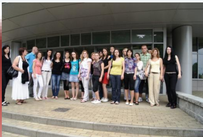
Kultúrna príprava Udział w wydarzeniach artystycznych Krosna