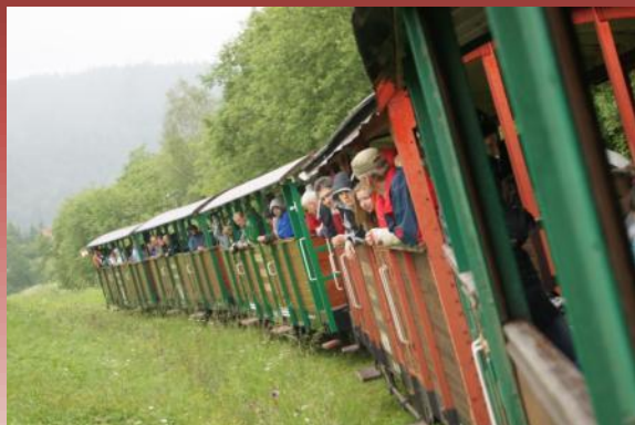
Cesta vláčikom Podróż kolejką wąskotorową