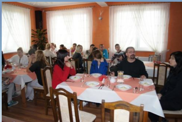
Tešíme sa na obed Oczekiwanie na obiad