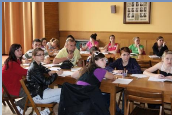
Jazykový kurz Kurs języka polskiego