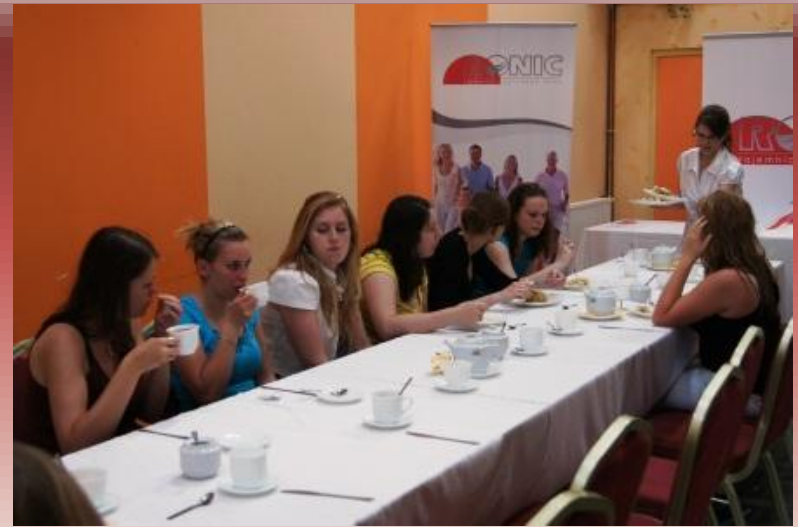
Večerné rozbory so žiakmi Ocena dnia podczas wieczornego posiłku