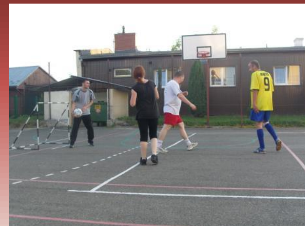
Trochu športu nezaškodí