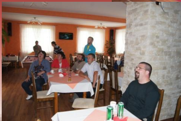
A podíme na futbal Przejście do piłki nożnej