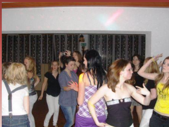
Večerná diskotéka – najlepšia zábava