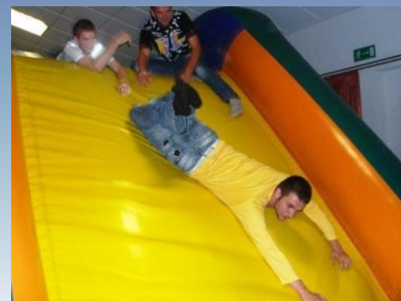
Raz hore a raz dole kopcom Raz do góry raz na dół