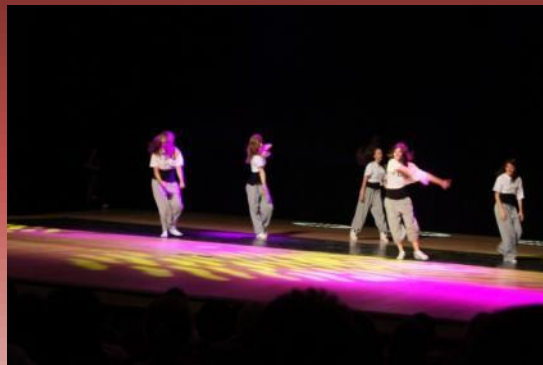
Tanečné vystúpenie Występ grupy tanecznej