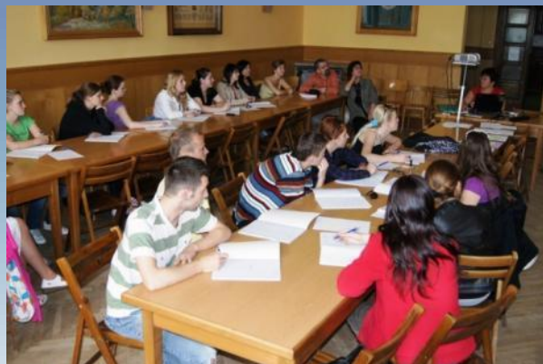
História Poľska Wykład z historii Polski